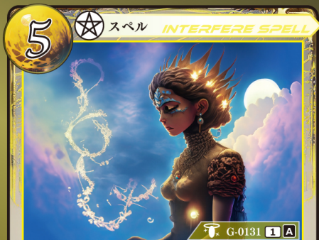
かみ かんしょう 神による干渉

相手が手札からイベントカードをプレイするとき 相手がプレイするイベントカード1枚の プレイを無効にして、トラッシュする。