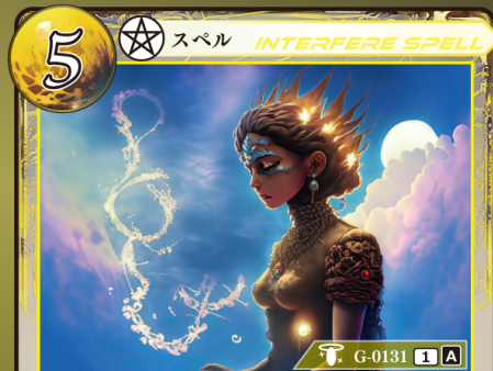
かみ かんしょう 神による干渉

相手が手札からスペルカードをプレイするとき 相手がプレイするスペルカード1枚のプレイを 無効にして、トラッシュする。