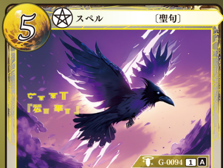
てっつい 鉄槌『ヴェルー』