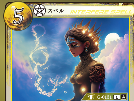
かみ かんしょう 神による干渉

相手が手札からイベントカードをプレイするとき 相手がプレイするイベントカード1枚の プレイを無効にして、トラッシュする。