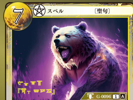
てっつい 鉄槌『グアチニリ』