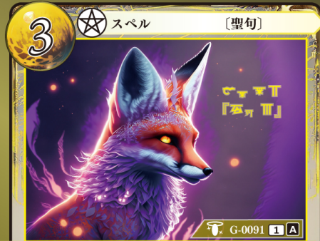
てっつい 鉄槌『フォウ』

このカードはデッキに4枚まで入れられる。 自分のトラッシュにゲウダカードがあるなら、 このカードはプレイできない。