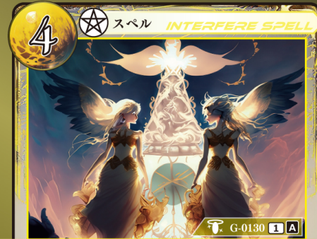
じゅもん しんだん 呪文の神断

相手が手札からスペルカードをプレイするとき 相手がプレイするスペルカード1枚のプレイを 無効にして、トラッシュする。