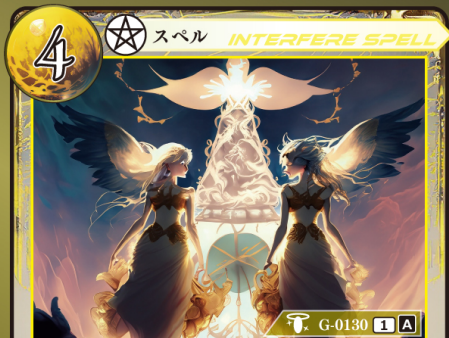
じゅもん しんだん 呪文の神断

相手が手札からスペルカードをプレイするとき 相手がプレイするスペルカード1枚のプレイを 無効にして、トラッシュする。