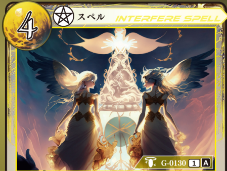
じゅもん しんだん 呪文の神断