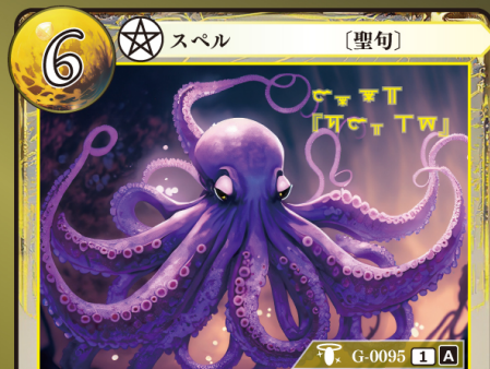
てっつい 鉄槌『クティアス』