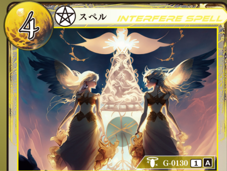
じゅもん しんだん 呪文の神断

相手が手札からスペルカードをプレイするとき 相手がプレイするスペルカード1枚のプレイを 無効にして、トラッシュする。