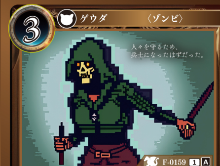
ゾンビソルジャー