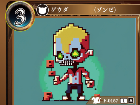
あくじき 悪食ゾンビ

このカードはデッキに4枚まで入れられる。 自分の山札からカードが1枚、直接トラッシュされるたび、このゲウダの上に悪食チップを1個置く。 このゲウダは置かれている悪食チップ1個につき+1 | +1される。 自分のターン終了時、このゲウダに置かれている悪食チップをすべて取り除く。