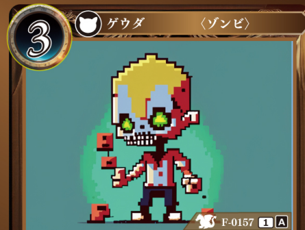
あくじき 悪食ゾンビ

このカードはデッキに4枚まで入れられる。 自分の山札からカードが1枚、直接トラッシュされるたび、このゲウダの上に悪食チップを1個置く。 このゲウダは置かれている悪食チップ1個につき+1 | +1される。 自分のターン終了時、このゲウダに置かれている悪食チップをすべて取り除く。