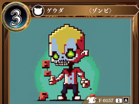
あくじき 悪食ゾンビ

このカードはデッキに4枚まで入れられる。 自分の山札からカードが1枚、直接トラッシュされるたび、このゲウダの上に悪食チップを1個置く。 このゲウダは置かれている悪食チップ1個につき+1 | +1される。 自分のターン終了時、このゲウダに置かれている悪食チップをすべて取り除く。