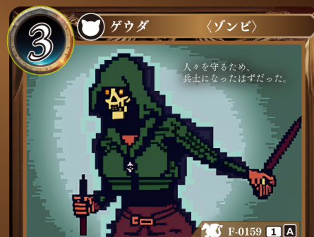
ゾンビソルジャー