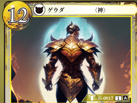
せんしん 戦神 アレス