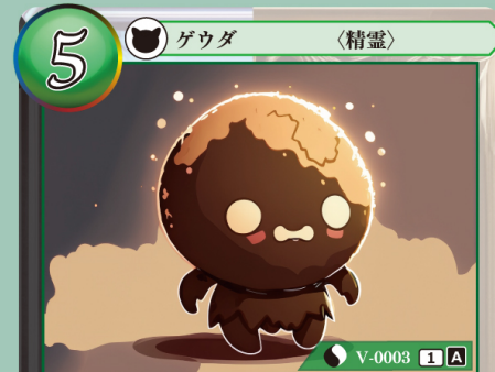
だいち せいれい 大地の精霊