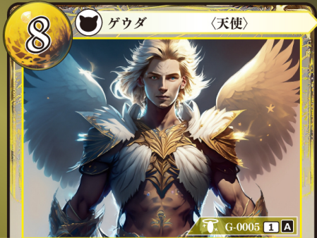
だいてんし 大天使 ミカエル