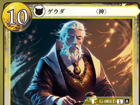
しほうしん 司法神 フォルセティ