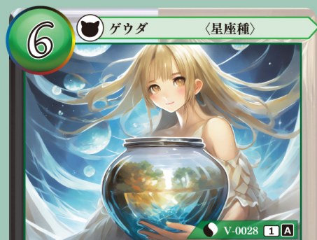
ほうびんきゅう 宝瓶宮 アクアリウス

このゲウダを手札から自分の場に出したとき、相手の場にいるゲウダを2体まで選び、持ち主の手札に戻す（選んだカードにつけられているカードはトラッシュする）。