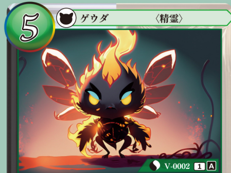
ひ せいれい 火の精霊