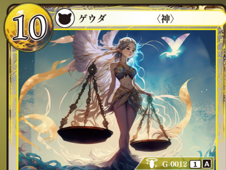
おきて めがす 掟の女神 テミス