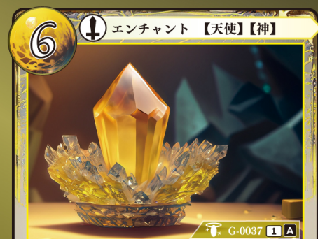
てんせき 天石 イリミオン

エンチャントされている〈天使〉〈神〉は +2 | +2 されるとともに、単体のこの〈神〉〈天使〉とバトルをしている相手ゲウダは、バトル終了時まですべての能力を失う。