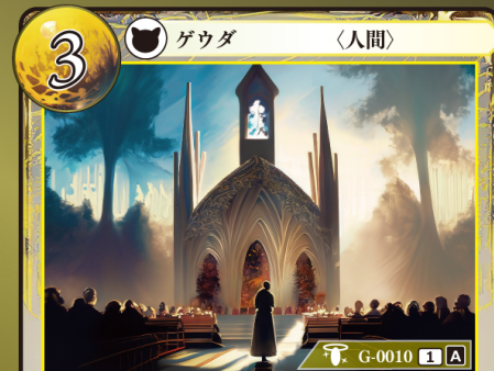
けいけんなしんじや 敬虔な信者