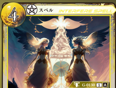
じゅもん しんだん 呪文の神断

相手が手札からスペルカードをプレイするとき相手がプレイするスペルカード1枚のプレイを無効にして、トラッシュする。