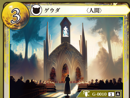
けいけんなしんじや 敬虔な信者