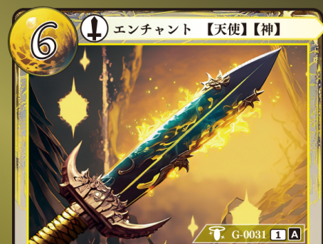
てんけん 天剣 ルミエード

エンチャントされている〈天使〉〈神〉は +4 | +0 され「急襲」の能力を得る。