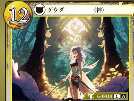
しゅしん 狩神 アルテミス