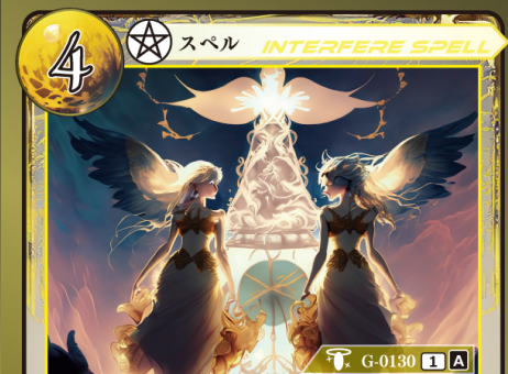
じゅもん しんだん 呪文の神断

相手が手札からスペルカードをプレイするとき相手がプレイするスペルカード1枚のプレイを無効にして、トラッシュする。