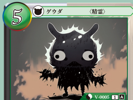
やみ せいれい 闇の精霊