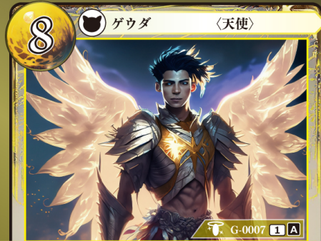
だいてんし 大天使 ラファエル