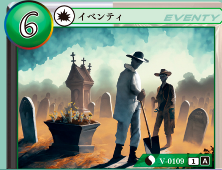
ししゃ ぼうとく 死者への冒涇