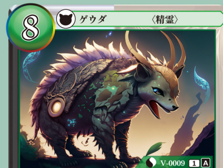
だいち だいせいれい 大地の大精霊 ジオ

パーン：このゲウダを表向きで自分のコストゾーンに置く（これにつけられているカードはトラッシュする）。