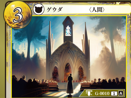
けいけんなしんじや 敬虔な信者