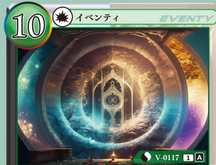
アカシックレコード 全世界記録層

自分の山札を上から2枚公開し、その中から1枚選び、手札に加える。残りのカードは、コストゾーンに表向きで置く。