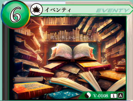
ふるほんしゅうしゅう 古本収集