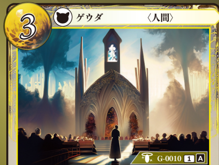
けいけんなしんじや 敬虔な信者