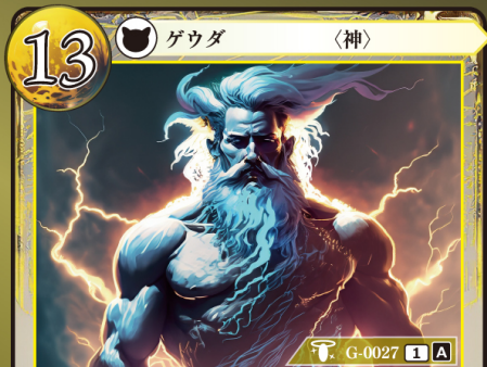
しじょうしん 至上神 ゼウス