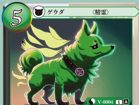
かぜ せいれい 風の精霊