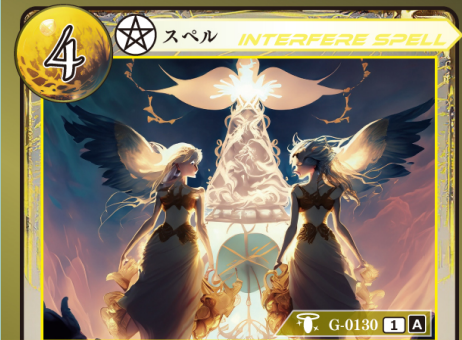
じゅもん しんだん 呪文の神断