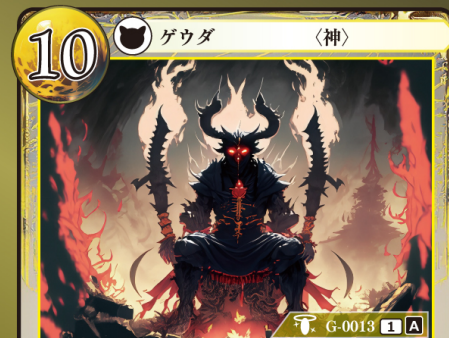
めいかい さいしん どんま 冥界の裁神 閻魔