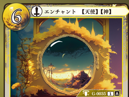
てんきょう 天鏡 カーミアン

エンチャントされている〈天使〉〈神〉は +0 | +4 されるとともに、相手が手札からプレイするイベントの効果を受けない。