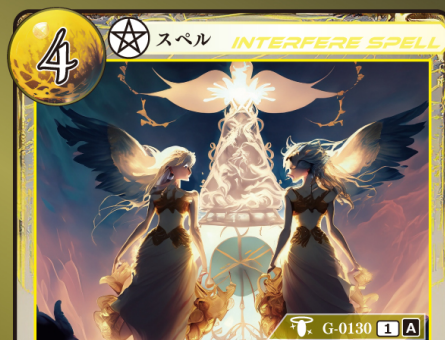
じゅもん しんだん 呪文の神断

相手が手札からスペルカードをプレイするとき相手がプレイするスペルカード1枚のプレイを無効にして、トラッシュする。