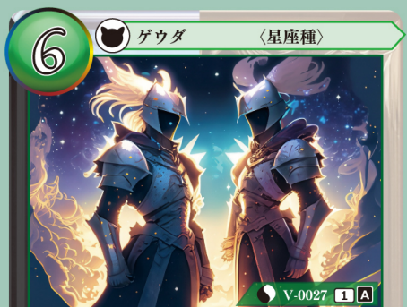
そうじきゅう 双児宮 ジェミニ

このゲウダを手札から自分の場に出したとき、このゲウダの上に分身チップを1個置く。