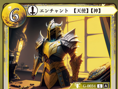
てんがい 天鎧 パガエミエ

エンチャントされている〈天使〉〈神〉は +4 | +0 され「急襲」の能力を得る。