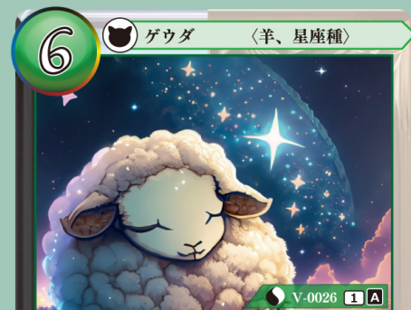
はくようきゅう 白羊宮 アリエス