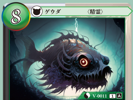
やま だいせいれい 闇の大精霊 スコタディ

バーン：自分のトラッシュからカードを1枚選び、コストゾーンに表向きで置く。その後、このゲウダをトラッシュする。