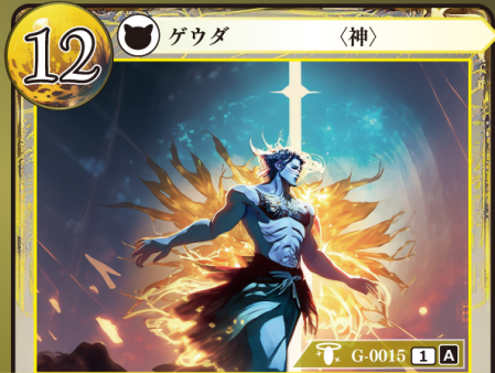
げいしん 芸神 アポロン

パーン：自分のコストゾーンのカードをそのままの向きでまとめて好きなだけ選び、手札に戻す。その後、相手は相手自身のコストゾーンの枚数が自分と同じになるように、相手自身のコストゾーンのカードをそのままの向きでまとめて選び、手札に戻す。