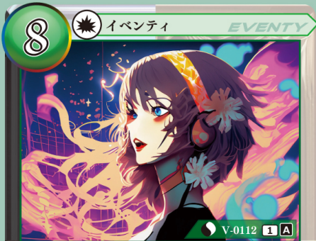
フェアリーヴァース

自分の山札を上から2枚公開し、その中から1枚選び、手札に加える。残りのカードは、コストゾーンに表向きで置く。