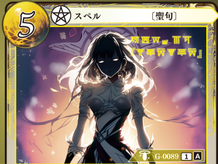
はんしょうく 反生句『ムルズムルズ』

このカードはデッキに4枚まで入れられる。 自分のトラッシュにゲウダカードがあるなら、 このカードはプレイできない。