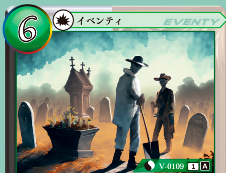
ししゃ ぼうとく 死者への冒険

自分のトラッシュからイベントカード を1枚選び、相手に見せてから手札に加 える。