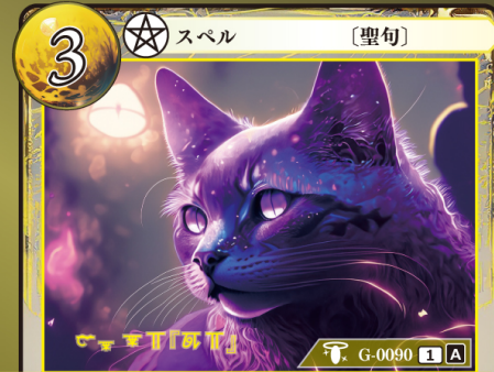
てっつい 鉄槌『ケイ』

バトルフェイス 3 | 1の『ケイ』ゲウダイミットカードを1枚、 自分の場に出す。