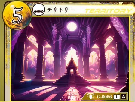
ほんしょうしんでん 反生神殿 ムルノワーズ

このテリトリーはゲウダの能力を受けない。 すべてのプレイヤーは自身のターン開始時、自身のトラッシュから〔聖句〕カードを1枚選び、対戦相手に見せてから手札に加えてもよい。