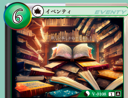
ふるほんしゅうじゅう 古本収集

自分の山札を上から5枚見て、その中から 1枚選び、手札に加える。残りのカードは 好きな順番で山札の下にウラ向きで戻す。