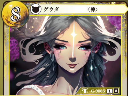
ほんしょうしん 反生神 ムルノワ

このゲウダはアウトにならない。 このゲウダは相手の場にいるゲウダの能力を受けない。 このゲウダは場からトラッシュに置かれるとき、代わりにバストゾーンに置く。 イベント能力：自分のトラッシュから〔聖句〕カードを3枚まで選び、相手に見せてから手札に加える。このイベント能力は1ターンに1回しか使えない。