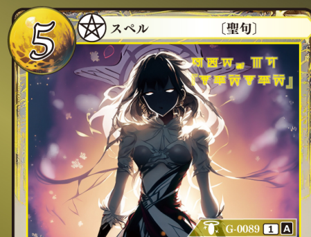
はんしょうく 反生句『ムルズムルズ』

相手が手札からゲウダカードをプレイするとき 相手がプレイするゲウダカード1枚のプレイを 無効にして、トラッシュする。