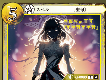
はんしょうく 反生句『ムルズムルズ』

このカードはデッキに4枚まで入れられる。 自分のトラッシュにゲウダカードがあるなら、 このカードはプレイできない。