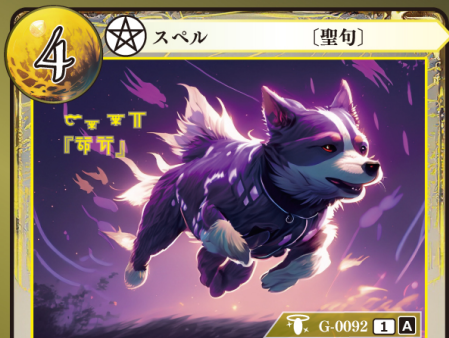
てっつい 鉄槌『ダグ』

バトルフェイス 3 | 3の『ダグ』ゲウダイミットカードを1枚、 自分の場に出す。