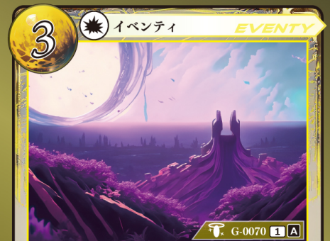
ばんぶつ なづ 万物の名付け

自分のトラッシュにゲウダカードがあるなら、このカードはプレイできない。 自分はカードを2枚引く。その後、手札を1枚選び、山札の一番下にウラ向きで置く。