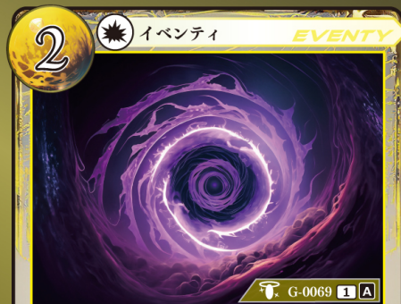
げんしょ そうぞう 原初の創造

このカードはデッキに4枚まで入れられる。 自分のトラッシュにゲウダカードがあるなら、このカードはプレイできない。 このカードの効果は、以下のどちらか1つを選ぶ。 ・自分はカードを1枚引く。 ・自分の山札の一番下のカードを手札に加える。