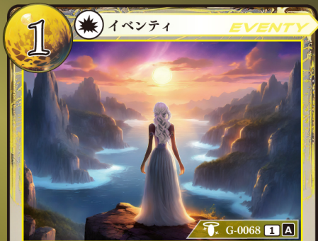
しゅ めぎ 主の目覚め

テリトリー / 場に出ているテリトリー以上の記載コストを持つ場合しかプレイできず、のルール / 以前のテリトリーはトラッシュされる。両盛の場合は両者トラッシュする。