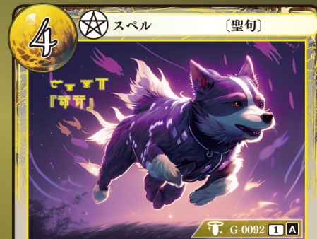
てっつい 鉄槌『ダグ』

バトルフェイス 2 | 2の『フォウ』ゲウダイミットカードを 1枚、自分の場に出す。