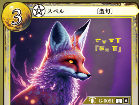
てっつい 鉄槌『フォウ』

バトルフェイス 3 | 1の『ケイ』ゲウダイミットカードを1枚、 自分の場に出す。