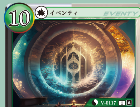
アカシックレコード 全世界記録層