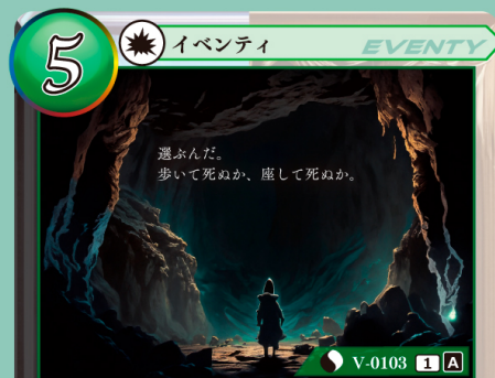
きょうふ ぜんしん 恐怖への前進

自分の山札を上から5枚見て、その中から 1枚選び、手札に加える。残りのカードは 好きな順番で山札の下にウラ向きで戻す。