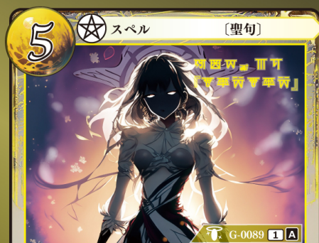
はんしょうく 反生句『ムルズムルズ』

相手が手札からゲウダカードをプレイするとき 相手がプレイするゲウダカード1枚のプレイを 無効にして、トラッシュする。