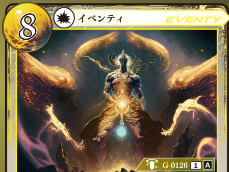
はや しんぱん 早すぎた審判