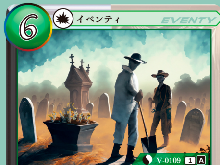
ししゃ ぼうとう 死者への冒涇