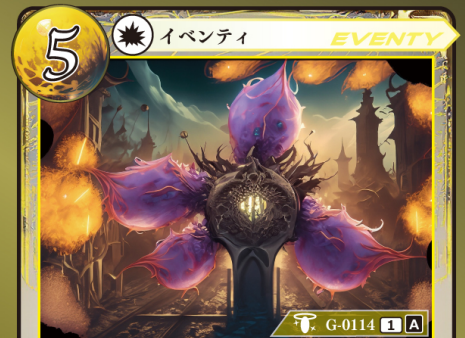
かみがみ うた 神々の唄 op.4 『クアツオル』

Leviang (レヴィオング慈教) ゲウダを 1体選び、持ち主のコストゾーンに表 向きで置く (選んだカードにつけられ ているカードはトラッシュする)。