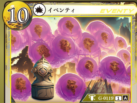
かみがみ うた 神々の唄 op.9 『ノウエム』