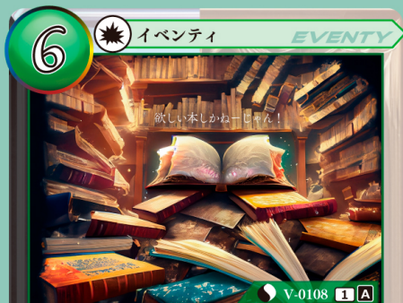
ふるほんしゅうしゅう 古本収集

自分の山札を上から5枚見て、その中から 1枚選び、手札に加える。残りのカードは 好きな順番で山札の下にウラ向きで戻す。