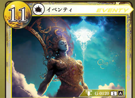
かみがみ うた 神々の唄 op.10 『デケム』