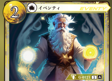
かみ 神のいたずら

カード上に置かれているチップを1つ選び、 別のカード上に置く。チップは移動の際に 好きな名前に変更してよい。