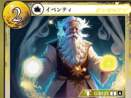
かみ 神のいたずら

テリトリー / 場に出ているテリトリー以上の記載コストを持つ場合しかプレイできず、 のルール / 以前のテリトリーはトラッシュされる。両者の場合は両者トラッシュする。