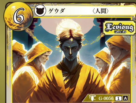
じきょうしさい レヴィオング慈教司祭 ミン

バーン：自分の場にいる Levi's (レヴィオング慈教) ゲウダを2体選び、トラッシュユする。その後、カードを1枚選び、その上に任意の名前のチップを2個置く。