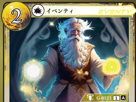
かみ 神のいたずら

カード上に置かれているチップを1つ選び、 別のカード上に置く。チップは移動の際に 好きな名前に変更してよい。