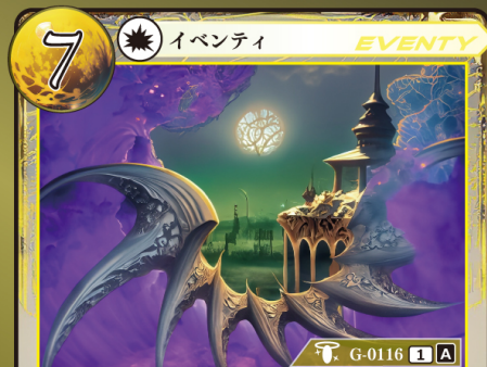
かみがみ うた 神々の唄 op.6 『セクス』