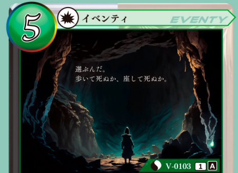
きょうふ ぜんしん 恐怖への前進

自分の山札を上から5枚見て、その中から 1枚選び、手札に加える。残りのカードは 好きな順番で山札の下にウラ向きで戻す。