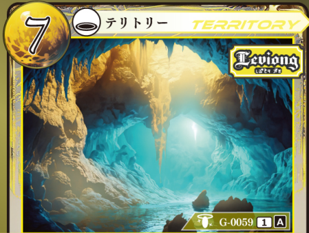
せいち 聖地 ルーヴェダーマ