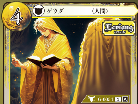
さいしじゅうしゃ 祭祀従者

このカードはデッキに4枚まで入れられる。 このゲウダを手札から自分の場に出したとき、このゲウダをバーン状態にする。 バーン：自分のカード上に置かれているチップを1つ選び、自分の別のカード上に置く。このとき、チップは任意の名前に変更してよい。