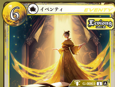
きょうこう いこう 教皇の威光

カード上に置かれているチップを1つ選び、 別のカード上に置く。チップは移動の際に 好きな名前に変更してよい。