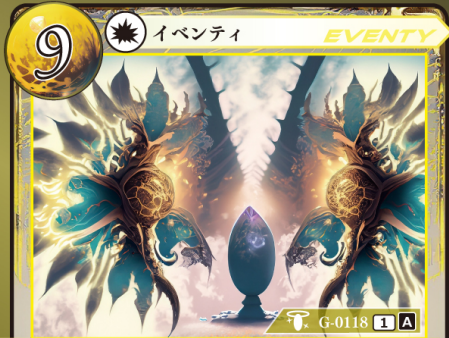
かみがみ うた 神々の唄 op.8 『オクト』