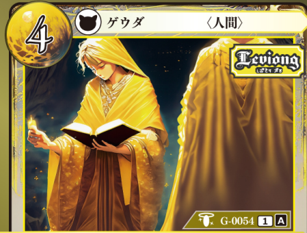
さいしじゅうしゃ 祭祀従者

このカードはデッキに4枚まで入れられる。 このゲウダを手札から自分の場に出したとき、このゲウダをバーン状態にする。 バーン：自分のカード上に置かれているチップを1つ選び、自分の別のカード上に置く。このとき、チップは任意の名前に変更してよい。