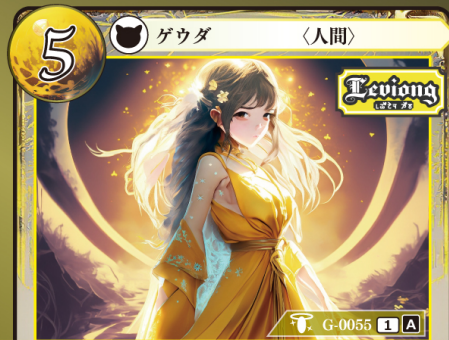
じきょうふくしさい レヴィオング慈教副司祭 カシ

バーン：自分の場にいる Levi's (レヴィオング慈教) ゲウダを1体選び、トラッシュユする。その後、カードを1枚選び、その上に任意の名前のチップを1個置く。