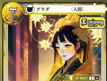
じきょうこう レヴィオング慈教皇 ハダ

バーン：自分の場にいる Levi's (レヴィオング慈教) ゲウダをn体選び、トラッシュユする (nは好きな数でよい)。その後、カードを1枚選び、その上に任意の名前のチップをn個置く。