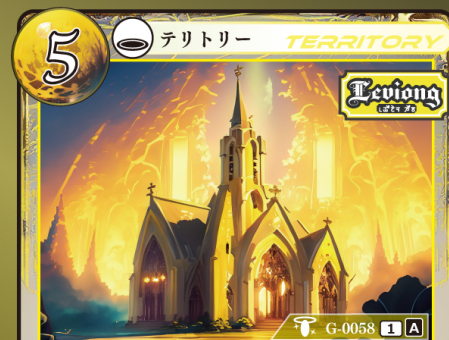
じきょうかい レヴィオング慈教会

テリトリー / 場に出ているテリトリー以上の記載コストを持つ場合しかプレイできず、 のルール / 以前のテリトリーはトラッシュされる。両盛の場合は両者トラッシュする。