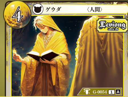
さいしじゅうしゃ 祭祀従者

このカードはデッキに4枚まで入れられる。 このゲウダを手札から自分の場に出したとき、このゲウダをバーン状態にする。 バーン：自分のカード上に置かれているチップを1つ選び、自分の別のカード上に置く。このとき、チップは任意の名前に変更してよい。