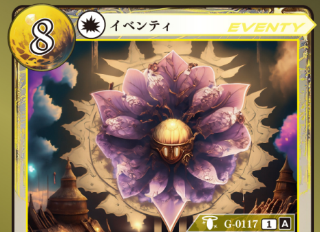
かみがみ うた 神々の唄 op.7 『セプテム』