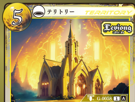
じきょうかい レヴィオング慈教会

このカードはデッキに4枚まで入れられる。 すべての Levi's (レヴィオング慈教) ゲウダは +0 | +2 される。