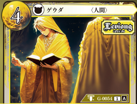
さいしじゅうしゃ 祭祀従者

このカードはデッキに4枚まで入れられる。 このゲウダを手札から自分の場に出したとき、このゲウダをバーン状態にする。 バーン：自分のカード上に置かれているチップを1つ選び、自分の別のカード上に置く。このとき、チップは任意の名前に変更してよい。