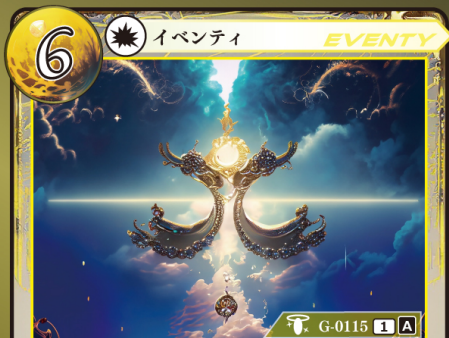
かみがみ うた 神々の唄 op.5 『クインケ』