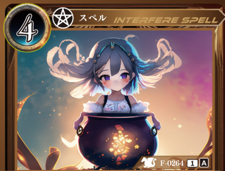
八大地獄詠唱「肆」 叫喚

相手が手札からカードをプレイするとき相手がプレイする記載コストが4以下のカード1枚のプレイを無効にして、トラッシュする。