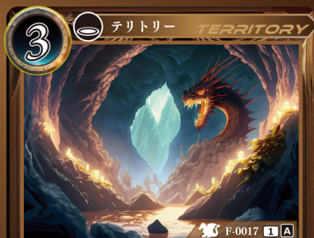
りゅうのどうくつ 竜の洞窟

エンチャントされている〈ドラゴン〉は +5 | +5され「バリアクラッシャー」の 能力を得る。