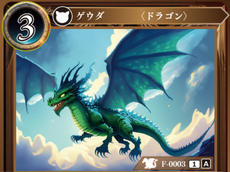
ひりゅう 飛竜 ワイバーン