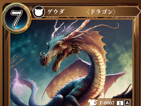
インフィニットドラゴン 悠久を生きる竜

自分の場にいるこのゲウダが相手カードの能力や効果、もしくはアウトになってトラッシュされる時、代わりに自分の場にいる別のゲウダを1体選び、トラッシュしてもよい。ただし、両者が同時にトラッシュされる時、この能力は使えない。