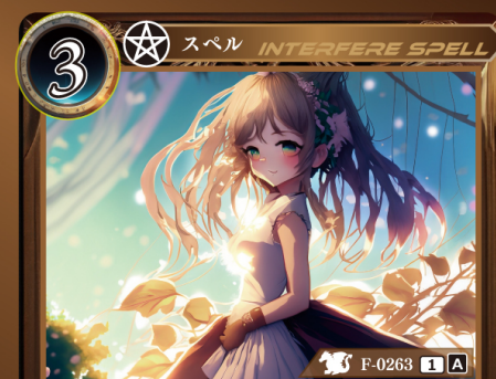
八大地獄詠唱「参」 衆合

相手が手札からカードをプレイするとき相手がプレイする記載コストが4以下のカード1枚のプレイを無効にして、トラッシュする。