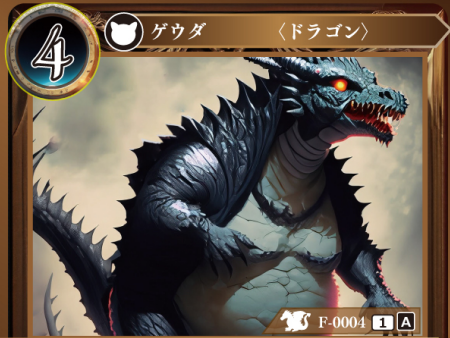
さいりゅう 碎竜 ロゲルガ

このゲウダを手札から自分の場に出したとき、相手の場にいる記載コストが2以下のゲウダを1体選び、トラッシュしてもよい。