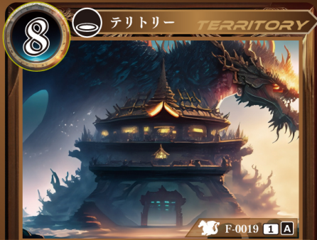
りゅうおうしんでん 龍王神殿