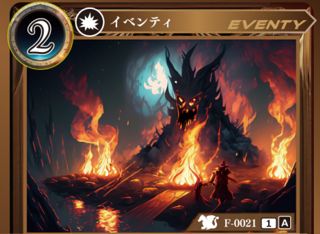
りゅうごい 竜乞い

自分の場に〈ドラゴン〉がないなら、 このカードはプレイできない。 エンチャントを1つ選び、トラッシュする。