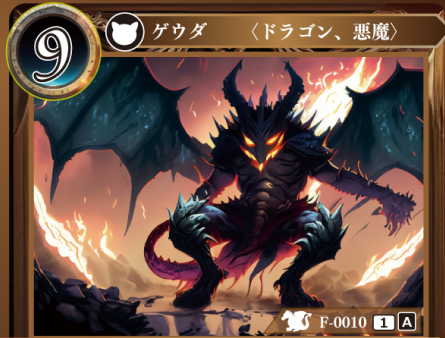
ソウルイーターデビルドラゴン 魂食の悪魔龍 グザバズ

このゲウダを手札から自分の場に出したとき、 自分の場にいるゲウダをn体選び、トラッシュ してもよい (nは好きな数でよい)。そうした なら、相手の場にいる記載コストがn以下の ゲウダをすべてトラッシュする。