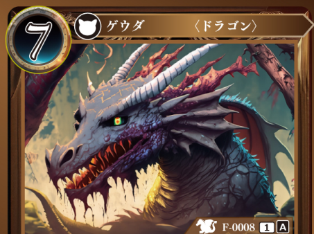
ふしょくりゅう 腐食竜 デッドリードラゴン

このゲウダを手札から自分の場に出したとき、記載コストが5以下のゲウダをすべてトラッシュする。その後、プレイヤーはそれぞれ、このカードの能力で自身のトラッシュに置かれたゲウダの数と同じ枚数、1 | 1の『ゾンビ』ゲウダイミットカードを自身の場に出す。