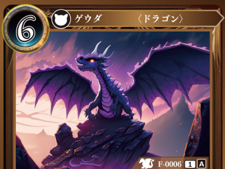
どくりゅう 毒竜 ミドラ

単体のこのゲウダとバトルをした相手ゲウダは、このバトルの生存判定時にアウトになる。