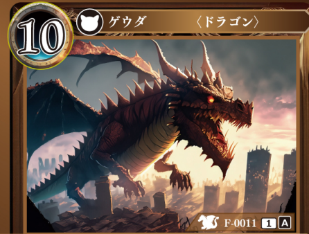
りゅうおう 龍王 ヴァルザルイード