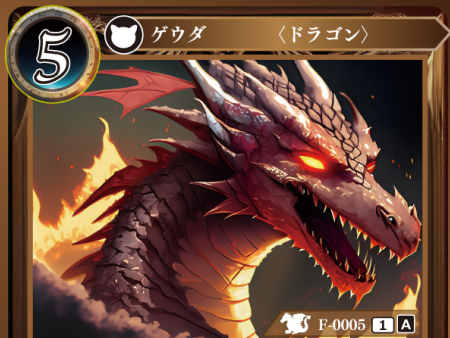
えんりゅう 焔竜 ファイアドレイク