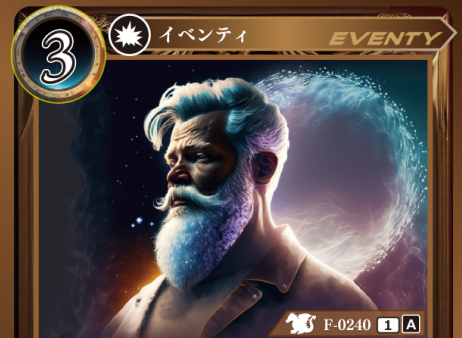
けっじつ イメージの結実