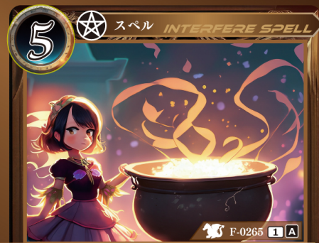
八大地獄詠唱「伍」 大叫喚

相手が手札からカードをプレイするとき相手がプレイする記載コストが5以下のカード1枚のプレイを無効にして、トラッシュする。