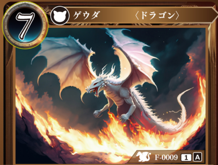
ちや ぐんりゅう 地焼きの君竜