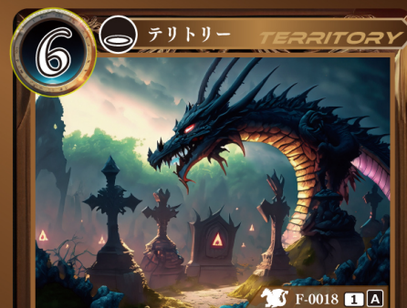
めいりゅう ほかば 盟竜の墓場