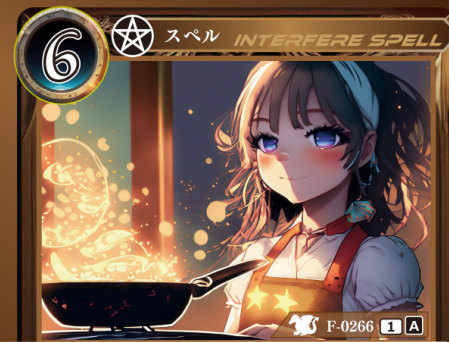
八大地獄詠唱「陸」 焦熱

相手が手札からカードをプレイするとき相手がプレイする記載コストが6以下のカード1枚のプレイを無効にして、トラッシュする。