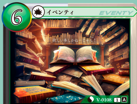
ふるほんしゅうしゅう 古本収集