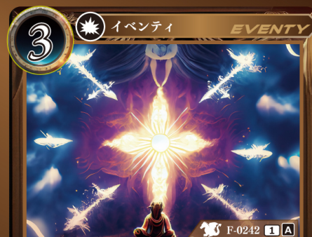
くじいの 挫きの祈り