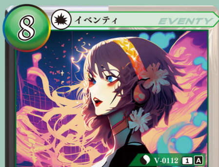
フェアリーヴァース

自分の山札を上から2枚公開し、その中から1枚選び、手札に加える。残りのカードは、コストゾーンに表向きで置く。